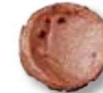
30745 Rose Gold