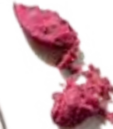
32792 Hot Pink