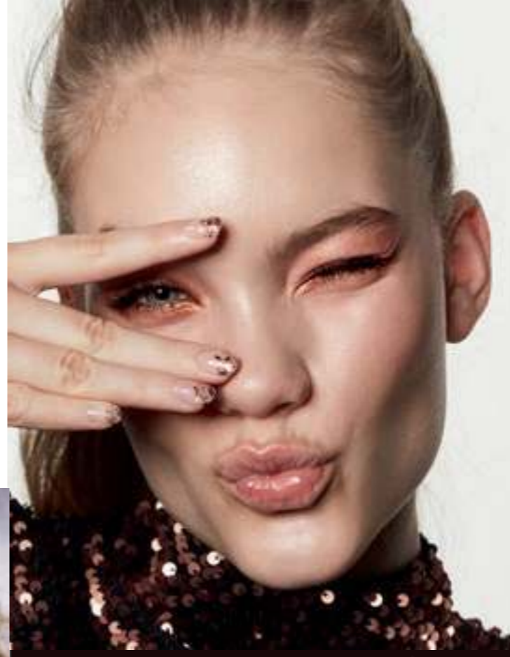
30749 Deep Indigo