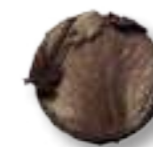
30746 Golden Brown