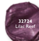
32724 Lilac Reef