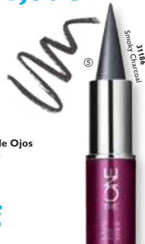
⑤ Delineador de Ojos Kajal The ONE 2.5 g.