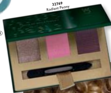
32769 Radiant Peony