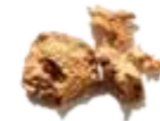
32796 Golden Yellow